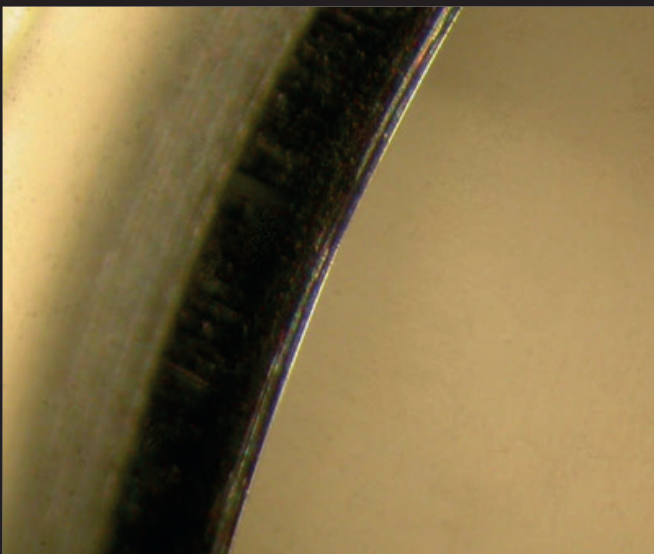
LÂMINA DE UM TRÉPANO TRADICIONAL