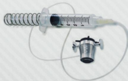
TRÉPANO RECEPTOR A VÁCUO